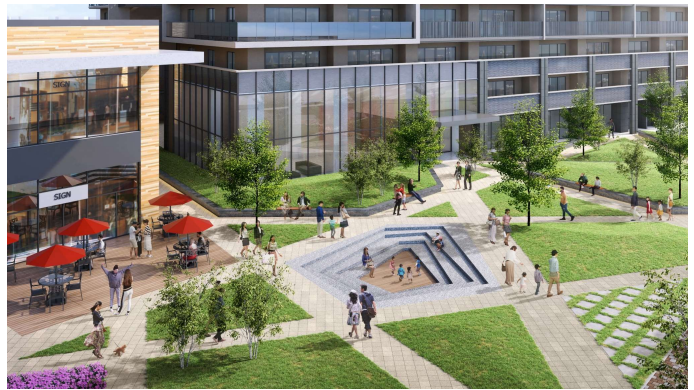
共用広場イメージ図