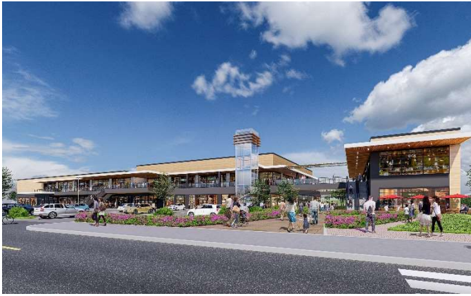
商業施設イメージ図