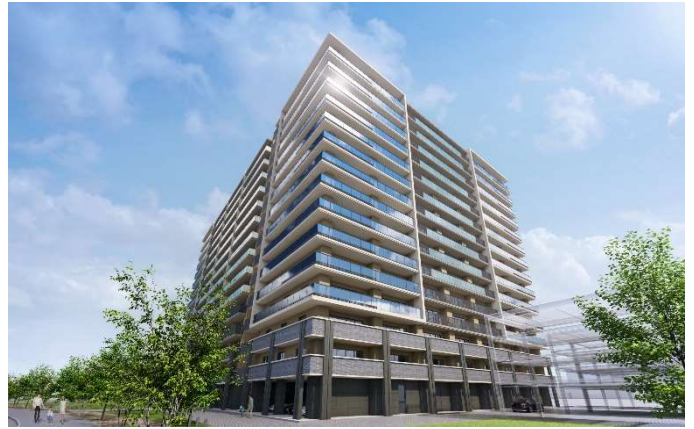
分譲マンションイメージ図