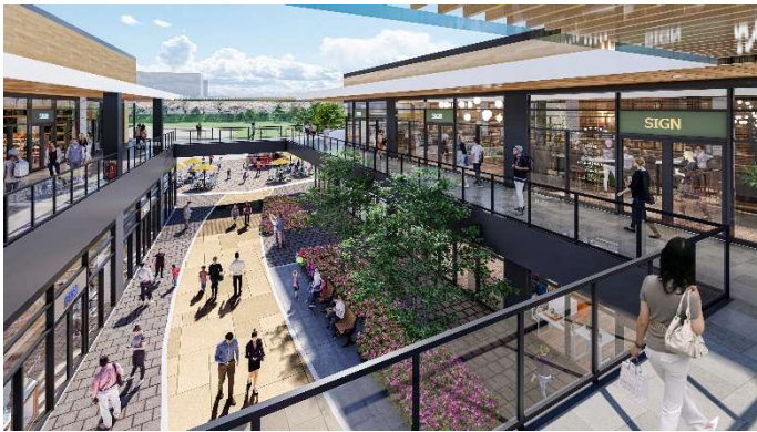
公園までのプロムナードのイメージ図